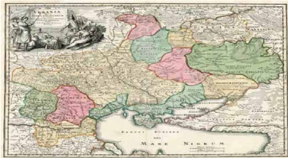
Карта «Україна – земля козаків...». Йоганн Баптист Гоманн, 1720 р.

На підставі карт де Боплана, карту України «Україна – земля козаків...» склав Йоганн-Баптист Гоманн, німецький географ та картограф, засновник картографічного видавництва у Нюрнберзі, яке було провідним видавцем карт у Німеччині 18 ст. Ця карта узагальнила всі відомі на той час знання географів та істориків про Україну. Її неодноразово перевидавали протягом 100 років, і вона стала одним із найвідоміших зображень наших територій.