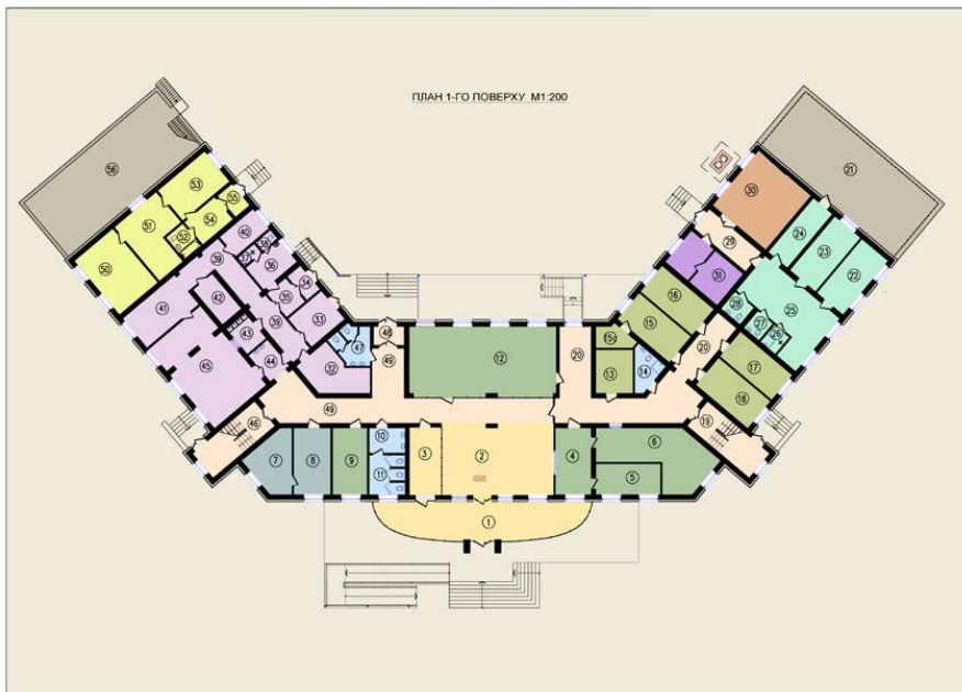
Рис. 1. План першого поверху адміністративної будівлі